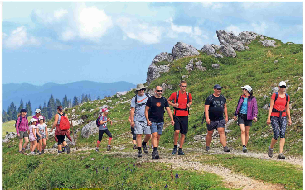
Lani je več kot 950 markacistov Planinske zveze Slovenije (PZS) urejanju poti namenilo več kot 35 tisoč prostovoljnih ur.